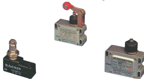
modèle de base à piston à levier à roulette, 1,2,3 contacts