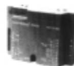
RT222 & RT244

Ces régulateurs analogiques sont utilisés avec des unités terminales pour la commande en séquence des vitesse du ventilateurs ainsi que les vannes de chauffage et refroidissement Ils sont utilisés avec des servomoteurs thermiques.